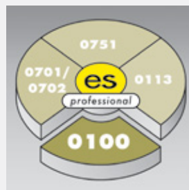
es control professional 0100