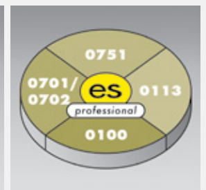
es control professional Komplett