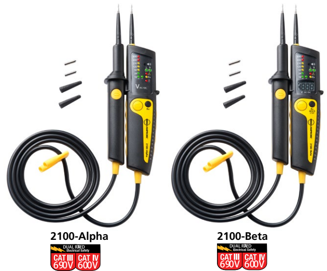
2100-Alpha DUAL RATED Electrical Safety CAT III 690V CAT IV 600V

Beha-Amprobe 2100-Alpha, 2100-Beta e 2100-Gamma sono tester di tensione a due poli robusti e affidabili per controlli di tensione e continuità. Realizzata per usi in ambienti industriali e commerciali, la serie 2100 presenta classe di sicurezza fino a CAT III 1000 V / CAT IV 600 V e misura tensioni fino a 1000 V AC e 1200 V DC (solo 2100-Gamma). Progettata con componenti rinforzati per garantire prestazioni affidabili, la serie 2100 presenta un grado di protezione IP 64, è conforme allo standard EN 61243-3:2014 per i tester di tensione e dotata di omologazione GS.