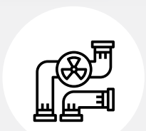
Instalační práce v průmyslu