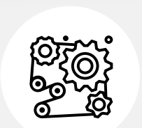
Motory a strojní zařízení