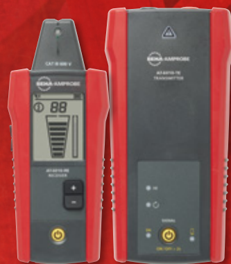
AT-6010-EUR Kit de traçage de câbles avancé